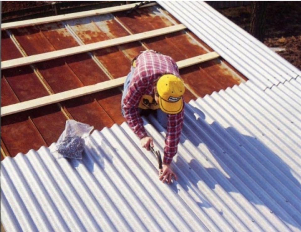
[3]? ?????????? ??????????

????????? ?????? ?????????????????? ?????????? ??? ??????? ??? ?????????????? ???????.