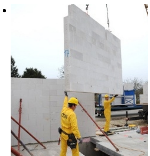
[5]????????? ?????????????????? ?????????????????? ? ??????????